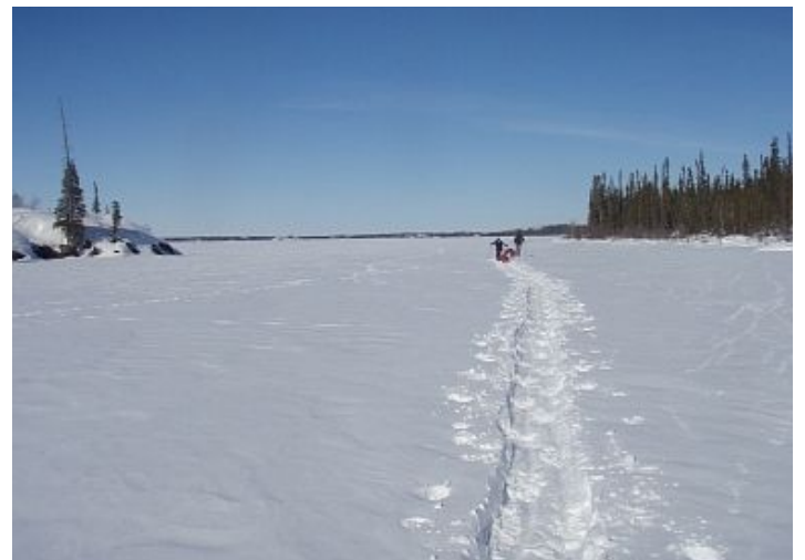
Arrivée sur le Grand Lac de l'Ours