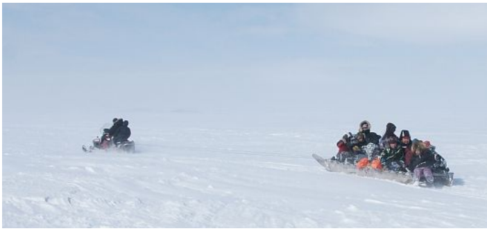
Transports scolaires !