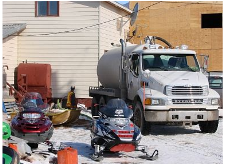
En l'absence d'eau courante, le camion ravitailleur du hameau vient remplir la citerne de la maison régulièrement.

Kugluktuk : là où il y a des rapides. A l'embouchure de la rivière Coppermine, sur le rivage du Golfe du Couronnement, Kugluktuk est l'un des quatre Hameaux du Kitikmeot, à l'ouest du Nunavut. Curieusement, hameau est le terme français consacré pour désigner l'entité administrative de la commune. Il y a 60 ans à peine, il n'y avait ici qu'une mission, un magasin de la Compagnie de la Baie d'Hudson et 7 familles vivant sous des tentes ! Au dernier recensement de 2006, on comptait 1302 âmes, Inuit à 91%. Ou plutôt Inuinait, car le continuum Inuit s'étend de l'Alaska à la côte Est du Groenland ! On y parle le plus souvent l'anglais, mais le gouvernement du Nunavut et le Hameau ont mis en œuvre une politique dynamique de réintroduction dès l'école primaire de la langue autochtone, l'inuinnaqtun.