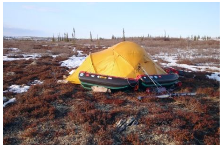
Bivouac sur la toundra, altitude 300 m