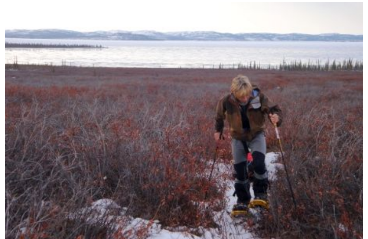
Sortie du Grand Lac de l'Ours et la baie Hornby au fond

Depuis quelques jours déjà nous avons un pressentiment. La température est bien trop élevée y compris la nuit. Nos craintes se confirment en approchant de la baie Hornby qui ouvre la piste ancestrale vers Kugluktuk à travers la toundra.. Le dégel a débuté et la neige fond à vue d'œil. La toundra est brune, parsemée de taches blanches.