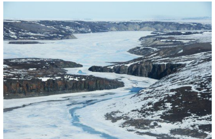
Les Bloody Falls , vue de l'hélicoptère le 28 avril 2010

Les Bloody Falls étaient l'ultime objectif des trois Piétons... si ce maudit printemps précoce ne les avait contraint à s'arrêter quelques 140 km plus au sud.