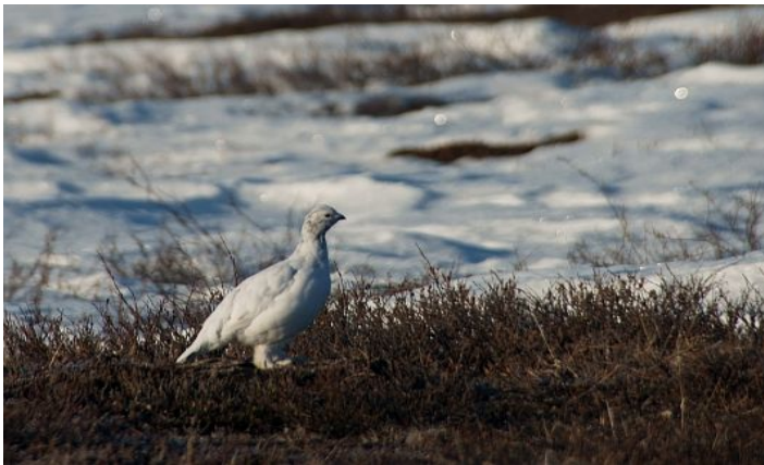
Lagopède femelle sur la toundra déneigée

En 2060 notre planète aura peut-être une augmentation moyenne de température de 2°C par rapport à 1750. Tous les animaux qui ont une adaptation physique et comportementale auront-ils le temps d'évoluer ?