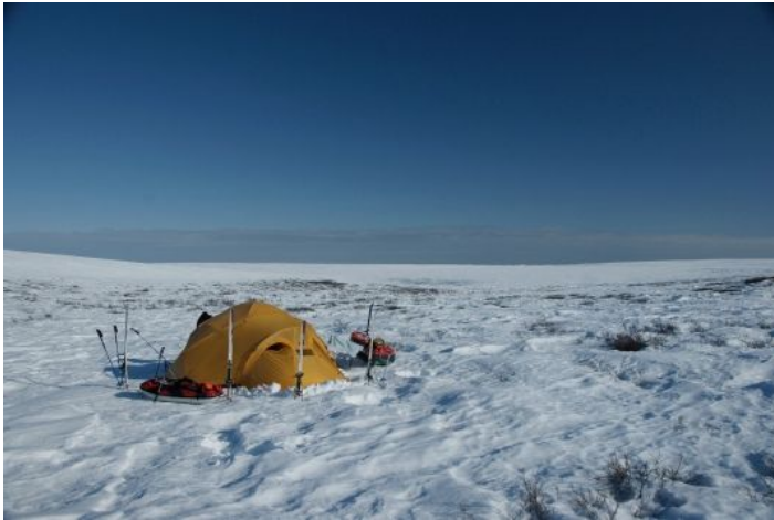
Bivouac sur la toundra, altitude 550 m