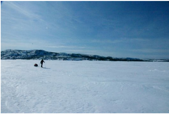
Sur le Grand Lac de l'Ours