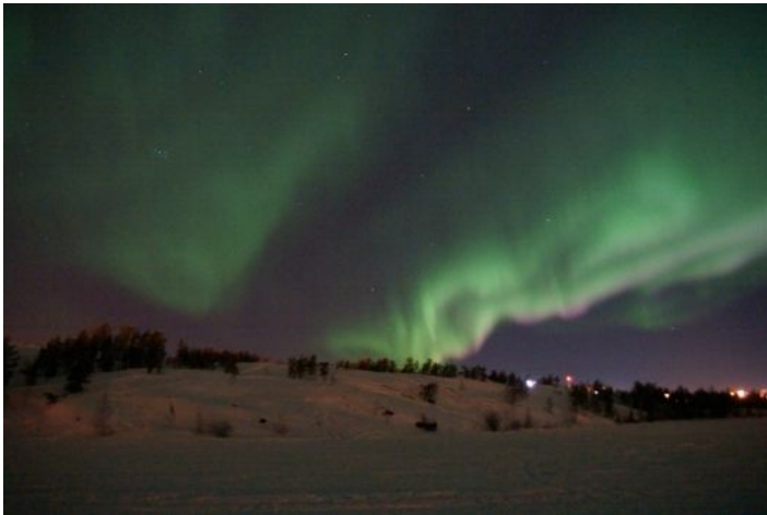
Dernière nuit avant le départ, Yellowknife, Frame Lake

Yellowknife est idéalement situé sous l'ovale des aurores boréales. Pour nous, occidentaux pétris de certitudes scientifiques, les aurores boréales résultent de l'interaction entre le vent solaire et le champ magnétique de la Terre. Pour les Inuit, les "arsaniit" sont les esprits du ciel qui jouent dans les ténèbres de l'hiver.