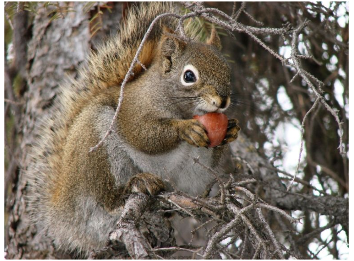
L'écureuil de la taïga