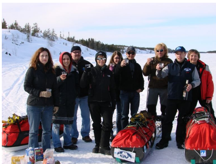
Franco-Ténois, anglophones, déné, un départ multi-culturel et chaleureux

Yellowknife, Samedi 13 Mars : Une joyeuse troupe d'amis s'est donnée rendez vous à l'extrémité de la ville, au bord d'un petit lac nommé fort à propos le Lac Grâce. C'est de là que partent pistes de moto-neiges et de traîneaux à chiens, bref une autoroute de la forêt sub-boréale.